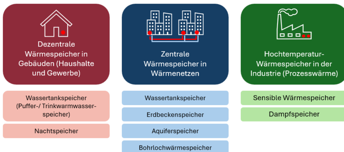
Abbildung 2: Übersicht über zentrale Wärmespeichertechnologien in den unterschiedlichen Anwendungsbereichen.

Ein Speicher für jede Situation. Tendenziell gilt: Je größer der thermische Speicher, umso öfter kann Wärme mit günstigem EE-Strom mit Wärmepumpen erzeugt und im Wärmespeicher gespeichert werden. Ein größerer Speicher bedeutet jedoch in der Regel höhere Investitionskosten. Aber auch in kleinerem Maßstab können Wärmespeicher sinnvoll sein, zum Beispiel als dezentrale Wärmespeicher in Gebäuden. Je nach Technik und Anwendungsfall können Speicherdauern von Stunden (zentrale oder dezentrale Pufferspeicher) über Tage bis zu Wochen oder Monaten (zentrale, saisonale Speicher) realisiert werden. Weitere bestimmende Faktoren sind die Kosten, der Platzbedarf, die Speicherverluste, sowie der Temperaturbereich des Speichers. Generell verlieren Wärmespeicher einen Teil der eingespeicherten Energie als Wärmeverluste an die Umgebung. Deswegen haben die Speicher eine technische oder natürliche Isolation, die Speicherverluste minimiert. Abbildung 2 gibt einen Überblick über zentrale Speichertechnologien, die in den drei Anwendungsgebieten von Wärmespeichern – Gebäude, Wärmenetze, Industrie – zum Einsatz kommen. Dabei handelt es sich bei den Wärmespeichern in Gebäuden und Wärmenetzen allesamt um sensible 1 Wärmespeicher. In der Industrie unterscheidet man dann zwischen sensiblen und weiteren Wärmespeichern. Die folgenden Kapitel vertiefen die drei Anwendungsgebiete und Wärmespeichertechnologien.