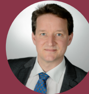
» Benjamin Görlach Ecologic Institute