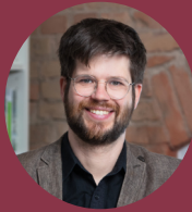
» Jan Steckel Mercator Research Institute on Global Commons and Climate Change