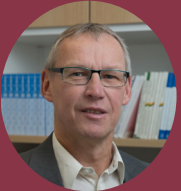
» Ulrich Fahl Universität Stuttgart –Institut für Energiewirtschaft und Rationelle Energie-anwendung